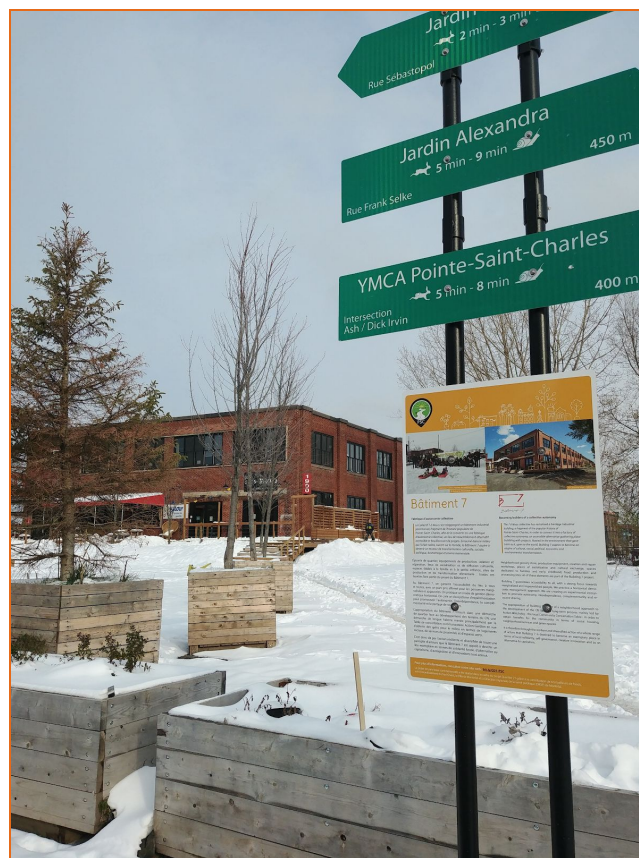
Quartier 21 : Un projet de Parcours vert et comestible dans le Sud de la Pointe, où les initiatives communautaires et citoyennes sont à l'honneur !