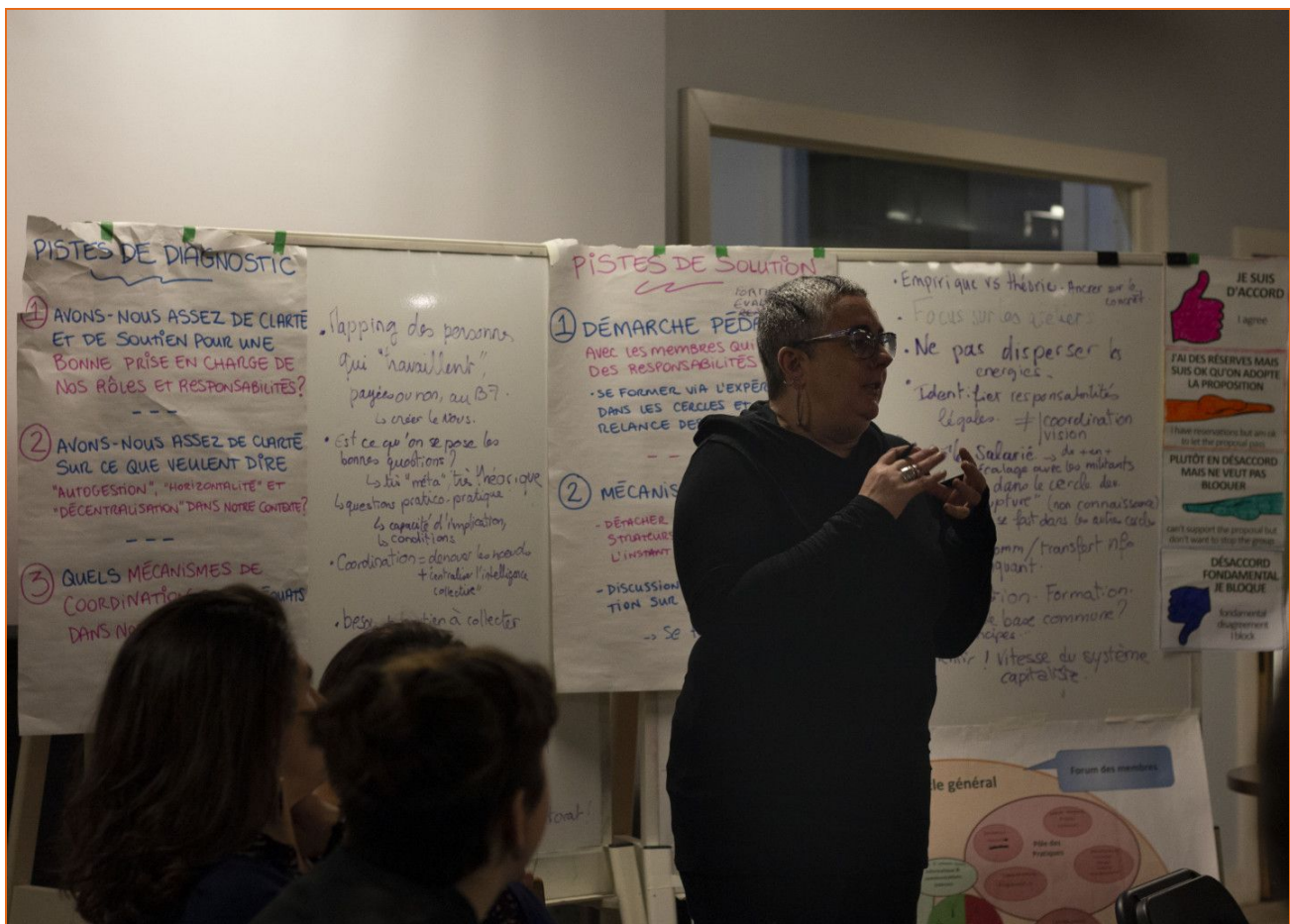
Travail en continu sur l'évolution de la structure démocratique au Bâtiment 7