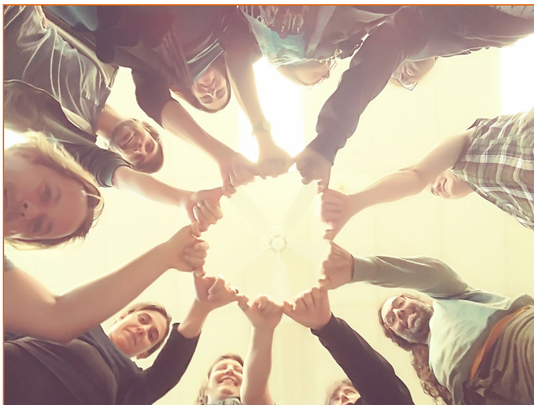
Une partie de l'équipe salariée au mois d'octobre 2019