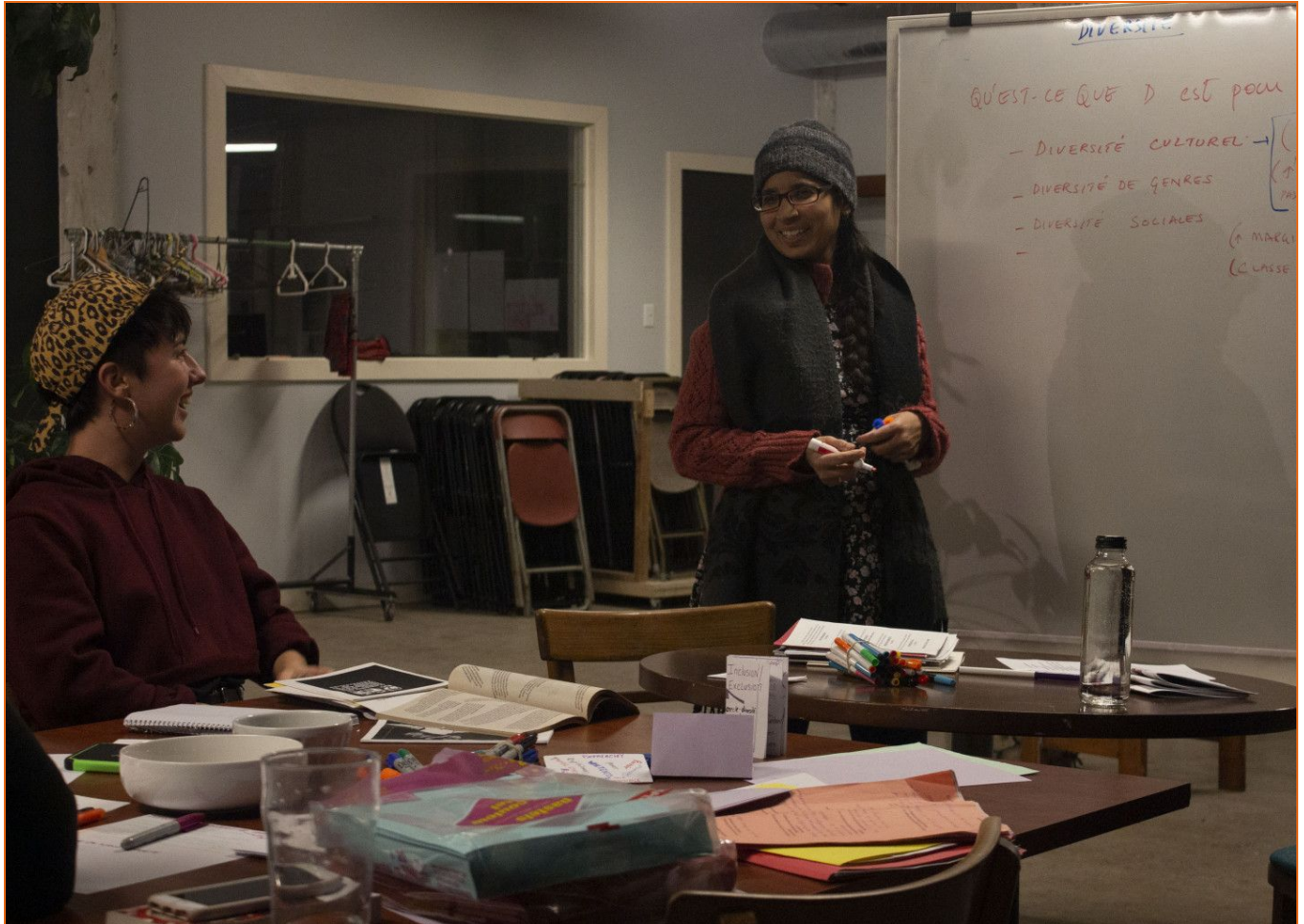
Travail du Cercle diversité et accessibilité pour la création d'un zine sur l'anti-oppression

réflexion sur les freins à la diversification de l'écosystème au Bâtiment 7. Le Cercle a aussi organisé une discussion sur l'inclusion/exclusion au mois de mai et un atelier sur l'anti-oppression durant l'été 2019. De plus, le Cercle a initié un processus de rédaction d'un code d'éthique au Bâtiment 7 et a entrepris la rédaction collective d'un zine sur les questions de diversité.