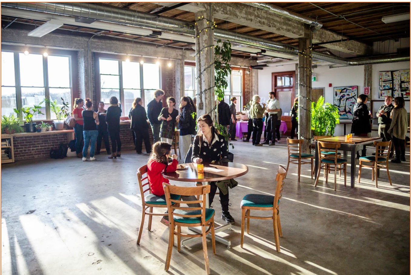
Le Bâtiment 7 a désormais de nouveaux espaces pour la location événementielle et pour sa programmation socioculturelle