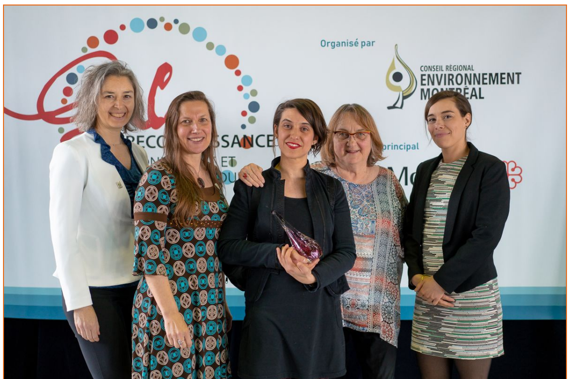
Remise du prix Gala Montréal Durable, du Conseil régional Environnement Montréal