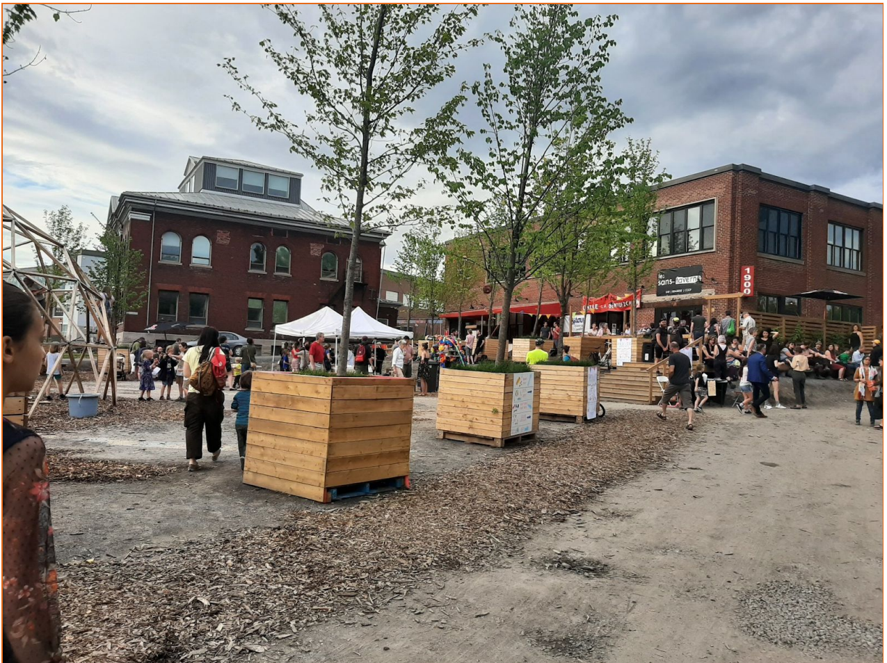
Plus de 700 personnes participent à la fête de l'été du Bâtiment 7 !

Quelques événements furent organisés, dont la deuxième édition de la fête de l'été le 21 juin 2019, marquant la fin de l'année scolaire. Ce sont plus de 700 personnes qui sont venues profiter de ce moment magique, où plusieurs des groupes occupants du Bâtiment 7 tenaient des activités en plein-air : ateliers de sérigraphie et de céramique, École d'art, Press Start, etc. Le 7 À NOUS a également participé, au mois de mai, à la Soirée Solidarité du Carrefour d'Éducation populaire de Pointe-Saint-Charles et au Festi-Pointe, le festival de quartier avec un kiosque de réparation de vélos.